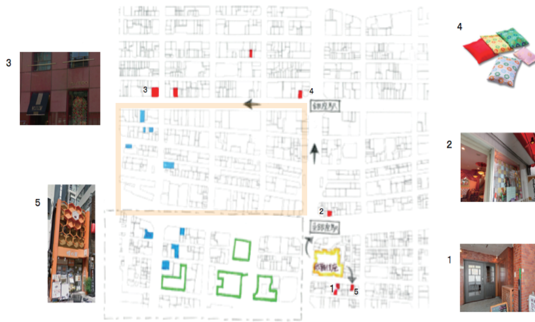
※地図上の色分け店舗について 赤・・・今回私が興味を持った店舗 緑・・・メガオフィス 青・・・同年代の友人にインタビューした際、名前が出た店舗